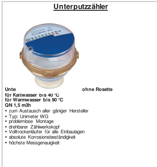
ABB / Elster